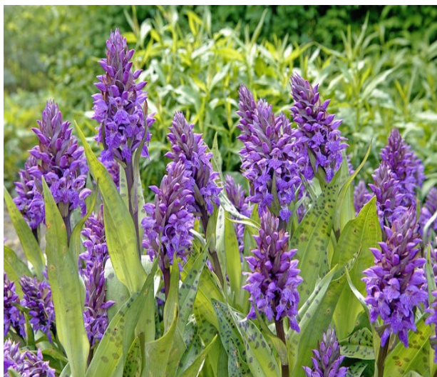
Gøgeurt på Kulsbjerg