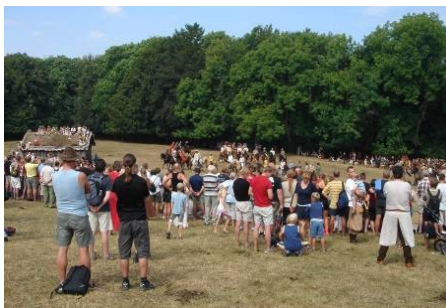
Tilskuere til en vikingekamp