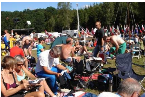
Stemmingsbillede fra stævnepladsen.

Løb igen torsdag eftermiddag og fredag med noget blandet vejr. Det var i denne uge at det meget våde august begyndte. Det skal dog nævnes, at det vist var meget forskelligt fra landsdel til landsdel.