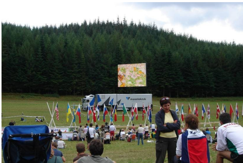
Storskærmen på VM stævnepladsen i Løndal Skov