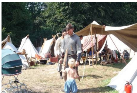
Lille viking udfordrer sin far