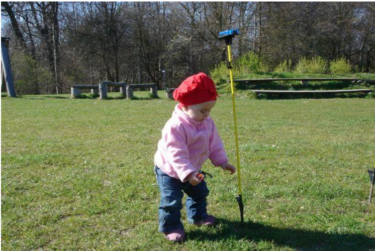
Yngste deltager ved det første rekrutteringsløb i Vintersbølle Skov den 14. april