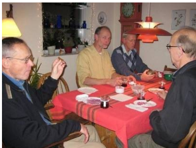
Er der flere æbleskiver?