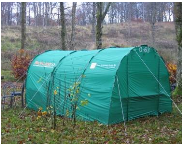
Teltet: "Puha endelig oppe"