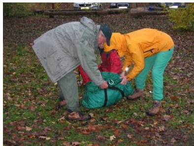
"Kom nu - ned med det piger!"