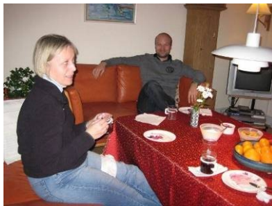
En tilfreds vinder i sofaen