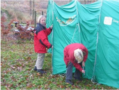
Lis: "Kan du få den ind?"