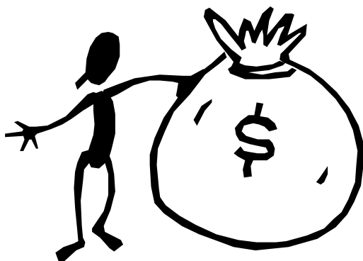
O-63's kasserer 2003