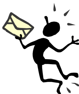
Nyt fra DOF