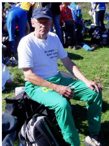
Efter, med en øl i hånden