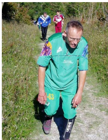
Før, på vej op ad Aborrebjerget

Jeg har også lige et par billeder som tydeligt viser, hvad et o-løb gør ved en herre 65 løber. Billederne er taget lige før start og efter løbet.