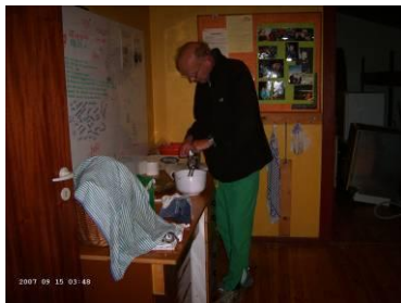
Nu har vi set det med!