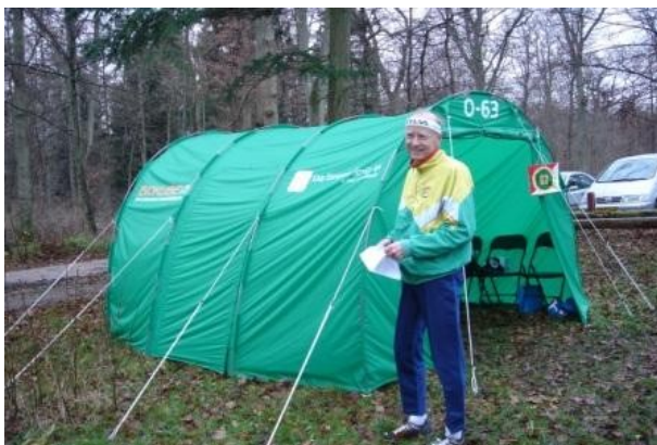
Vores nye flotte klubbelt med de 3 sponsorer Holscher's Frøhandel, Køng Entreprenør Service APS og Biokube