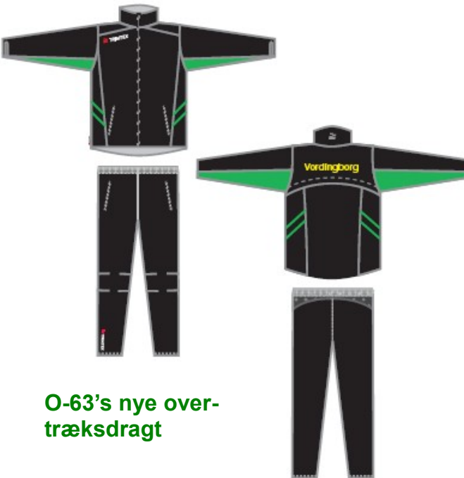
O-63's nye overtræksdragt

Klubbens nye løbedragt og overtræksdragt er designet af Trimtex. Vi skal afgive bestilling til Trimtex medio januar. Der er 7-9 ugers leveringstid, så til marts-april vil vi kunne stille op til løb i de flotte nye dragter.