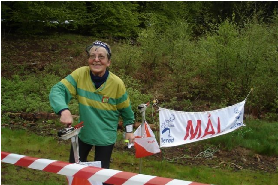
Glad og tilfreds "træner"

Jeg får lavet et ordentlig bom på vej til post 1 - det tog lidt tid at få læst ordentlig ind på kortet - der var vist også nogle ekstra ridestier, der ikke var med på kortet. Dette bom koster mig 4-5 minutter. Næste post tager jeg roligt og sikkert, og derefter går det fint resten af banen med et enkelt lille bom ved post 7. Jeg havde jo lyttet til "træneren". Resultatet er, at jeg kommer ind på en 3. plads - fornuftig løbet af den "gamle kone".