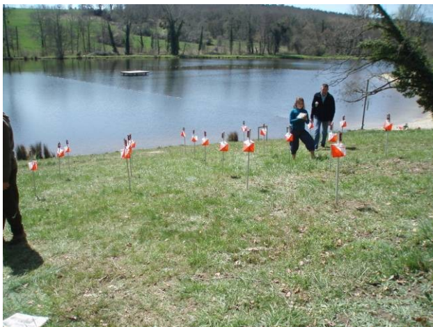
En fransk børnebane

Der var 15 deltagere i H70, midt på løbet skulle vi forcere en 20 m lodret skrænt, NEDAD, det var ikke let i det fugtige vejr og ej heller ufarligt, men det gik. Det blev til en 2. plads, 1.05 min efter dagens vinder, men 5 sek før den senere totalvinder. Sidst på løbet tog jeg fejl af en tvungen vej, hvor jeg så blev vinket tilbage, her røg dagens 1. plads.