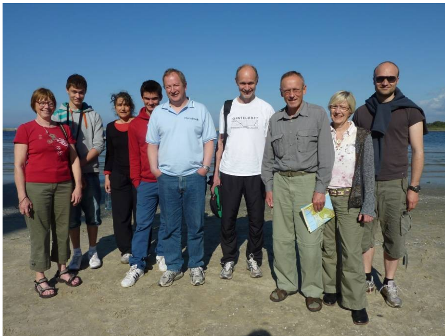
På udflugt til Swinemünde i Polen