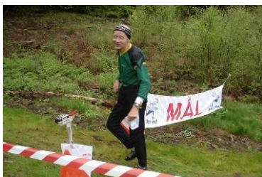
Her var én