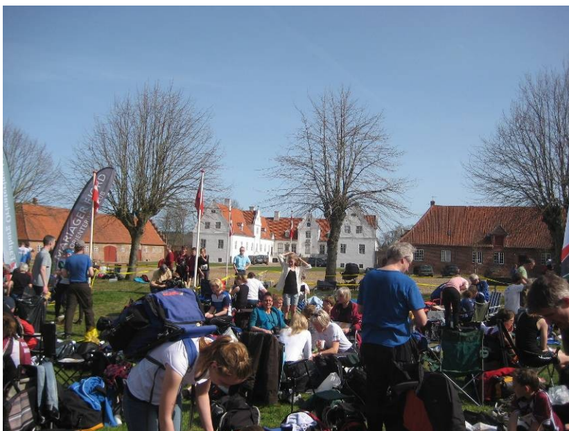
Fantastisk stævneplads på Bidstrup Gods ved DM Ultralang