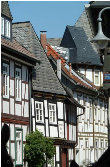
Smukke huse i Goslar