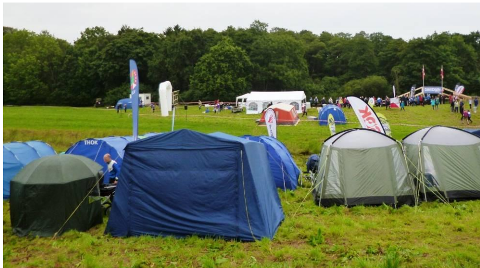
Udsigt over stævnepladsen

Familien Hviid og undertegnede tog fra Vordingborg ved 9 tiden og ca. 2 timer senere var vi på stævnepladsen med god tid til at få rejst teltet, inden de første regnbyger drog over pladsen.