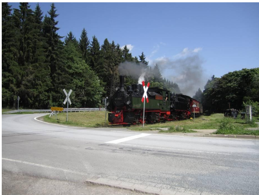
Usædvanligt transportmiddel til 3. etape af WMOC