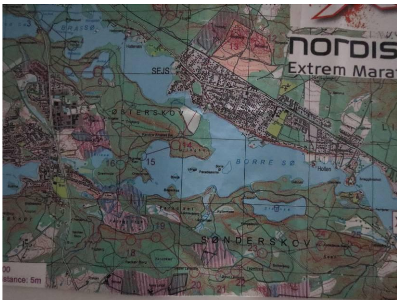
De 26 poster på dag 1.

Efter en lille forsinkelse gik starten kl. 1530 og et hav af rygsækbeklædte mennesker strøg af sted mod post 1. Ingen tvivl om at nogen var vant til dette her – oftest kunne man se det på størrelsen af rygsækken. Jo mindre, jo mere erfaren. Det kan godt være vi havde lidt mere i rygsækken end dem, men det var en fornøjelse at nappe nogle hold på orienteringen.