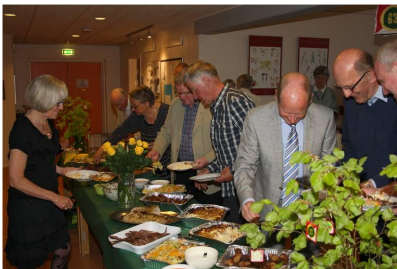
Trængsel ved buffeten

Nu vil jeg bede jer om at rejse jer og udbringe et trefoldigt leve for orienteringsklubben O-63 Vordingborg. Den længe leve. Skål!