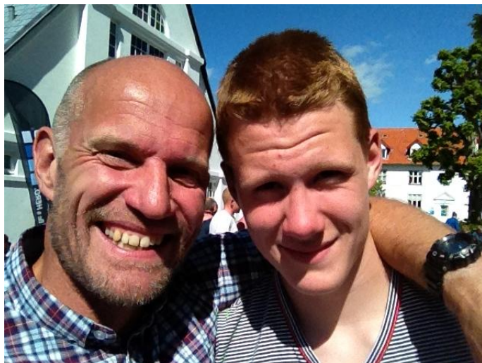
Far og Søn A/S – i mål.

Vi er klar til næste år – håber benene også bliver det.