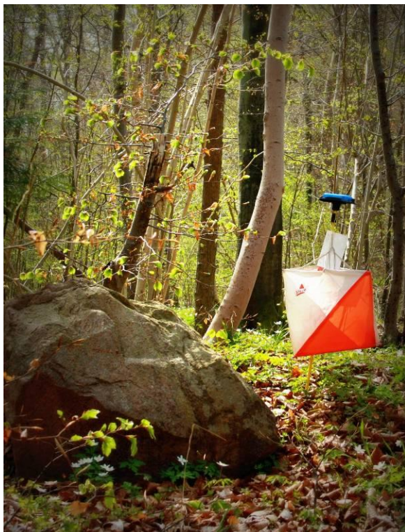
Post ved sten Jubilæumsløbet i Vintersbølle Skov