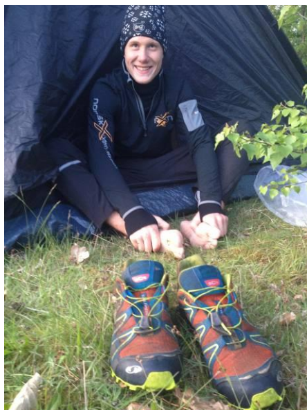
Smil og ømme fødder