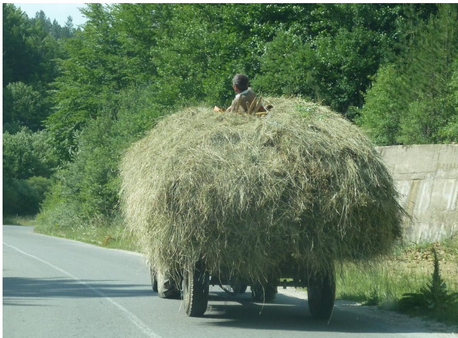
Et helt almindeligt syn på landevejen.

Naturen er flot med skovklædte bjerge. Overalt møder man løsgående køer, grise og får, og man skal ikke blive overrasket, hvis man på sit løb i den stejle skov møder en flok køer, som passes af en hyrdehund. Primitiv hestevogne læsset med hø eller landarbejdere på cykel eller gåben mødte vi på landevejen hver anden kilometer.