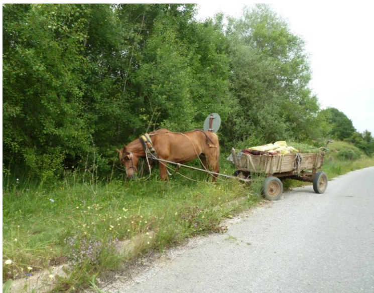
Spisepause på en landevej i Makedonien

Kalenderen for Vintertræningsløbene 2014/15 er trykt på bagsiden