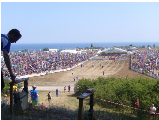
Opløb til mål

Vore resultater i de spændende og udfordrende skove vil jeg ikke dvæle ved, men skrive lidt om stævnets logistik. Hvordan flytter man f. eks. mere end 20.000 personer og et utal af biler fra indkvartering til stævneplads? Omtrent halvdelen bor i den såkaldte Central-Ort = en stor campingplads. Løbere herfra transporteres i busser, øvrige kan benytte egen bil.