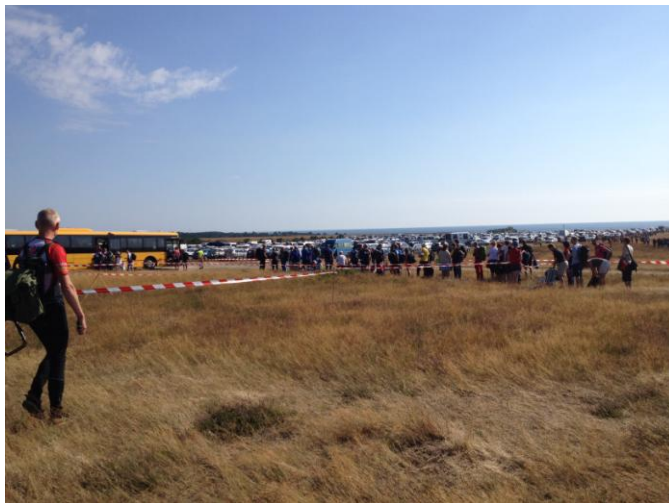
På vej fra bil til bus

Vore resultater i de spændende og udfordrende skove vil jeg ikke dvæle ved, men skrive lidt om stævnets logistik. Hvordan flytter man f. eks. mere end 20.000 personer og et utal af biler fra indkvartering til stævneplads? Omtrent halvdelen bor i den såkaldte Central-Ort = en stor campingplads. Løbere herfra transporteres i busser, øvrige kan benytte egen bil.