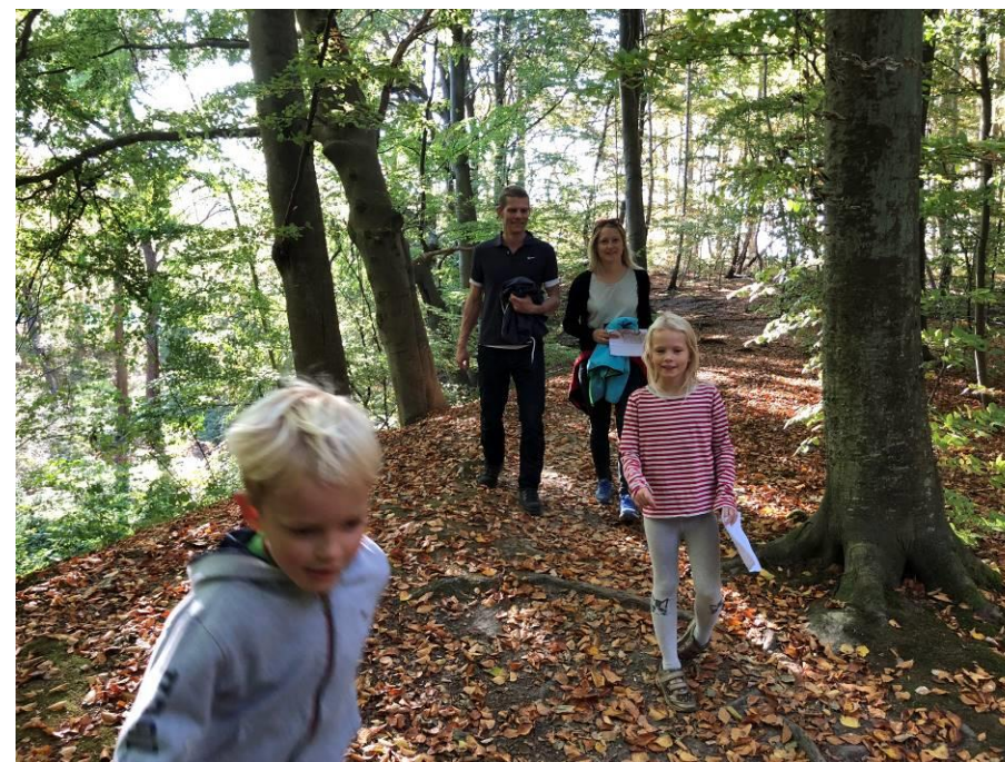
Glade løbere i Vintersbølle på Kend din Skov dagen