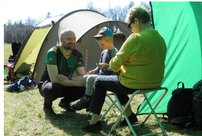
Hygge i klubbeltet