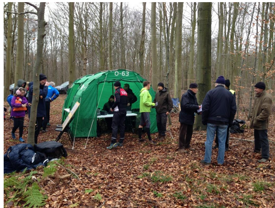
VTR i Corselitze Østerskov den 23. februar 2020