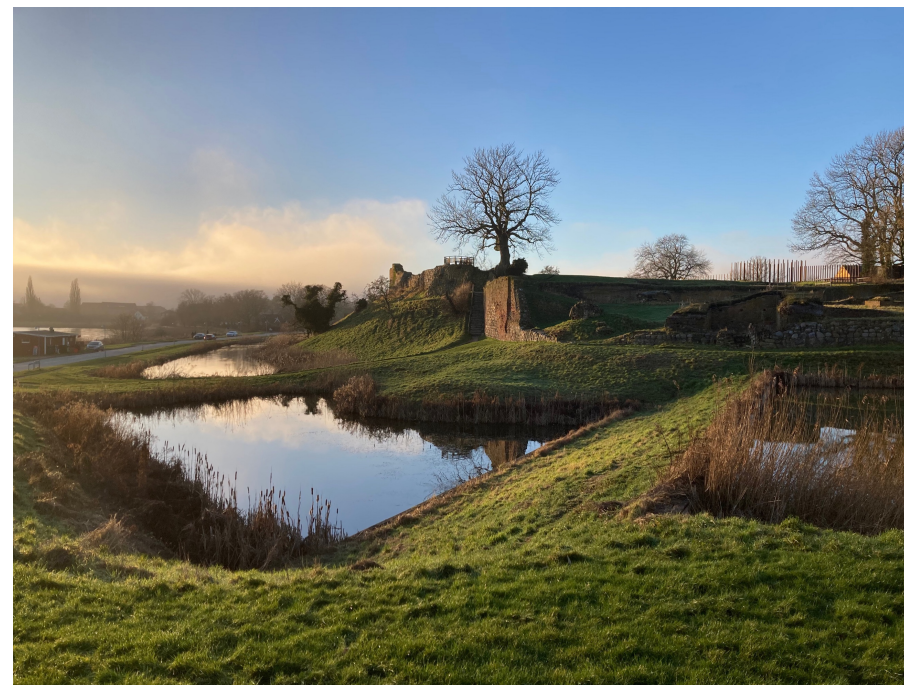
Vordingborg i flot januarlys