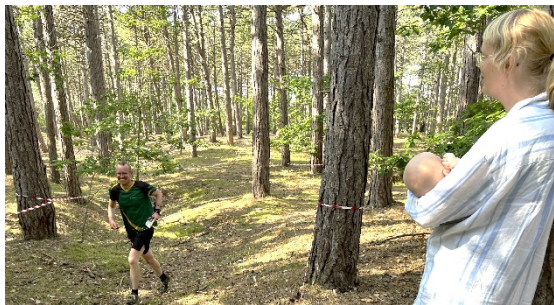
"Hvor bli'r du af, far?"

Kun 10 løbere havde taget turen helt til Rørvig, så det blev til en samlet tredjeplads, men i kraft af mange gode placeringer fik vi samlet nok point sammen til at kunne deltage i op- og nedrykningsmatchen 14 dage senere.